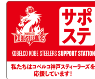
2023-24 シーズンポスター